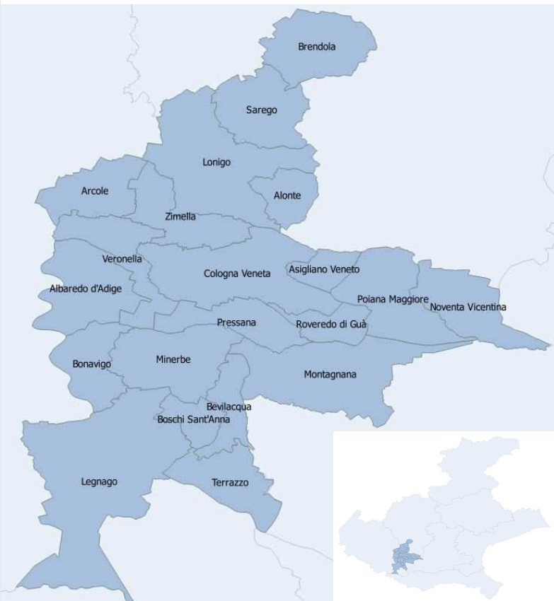
Fig.1: Area di massima esposizione